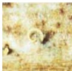
Emissão de um cirro