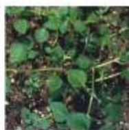
Morugem-branca ( Stellaria media )