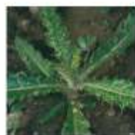
Cardo-das-vinhas ( Cirsium arvense )

Aneixas ( Rapistrum rugosum ), bardana-menor ( Xanthium spp.), bolsa-de-pastor ( Capsella bursa-pastoris ), camomila ( Matricaria chamomilla ), cardo-das-vinhas ( Cirsium arvense ), cardo-leiteiro ( Silbum marianum ), catassol ( Chenopodium album ), cavalinha-dos-campos ( Equisetum arvense ), corriola ( Convolvulus arvensis ), erva-moira ( Solanum nigrum ), ervilhaca ( Vicia spp.), fidalguinhos ( Centaurea cyanus ), moncos-de-peru ( Amaranthus retroflexus ), morugem-branca ( Stellaria media ), mostarda-dos-campos ( Sinapis arvensis ), papoila-das-searas ( Papaver rhoeas ), ranúnculo-dos-campos ( Ranunculus arvensis ), raspa-saias ( Picris echioides ), saramago ( Raphanus raphanistrum ), sempre-noiva ( Polygonum aviculare ), serralhas ( Sonchus spp.), trepadeira-das-balças ( Calystegia sepium ), veronicas ( Veronica spp.). Moderadamente susceptíveis: fumária ( Fumaria officinalis ), labagas ( Rumex spp.).