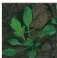
Papoila-das-searas ( Papaver rhoeas )