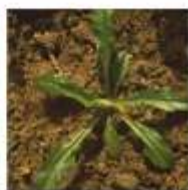
Fidalguinhos ( Centaurea cyanus )