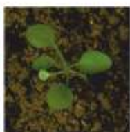
Bolsa-de-pastor ( Capsella bursa-pastoris )