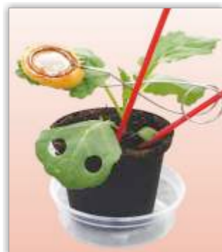
Planta para avaliar a atividade sistémica do produto.

É um produto com dupla sistemática (ascendente e descendente) e que actua por contacto e ingestão.