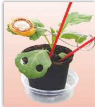
Planta para avaliar a atividade sistêmica do produto.

É um produto com dupla sistemica (ascendente e descendente) e que actua por contacto e ingestão.