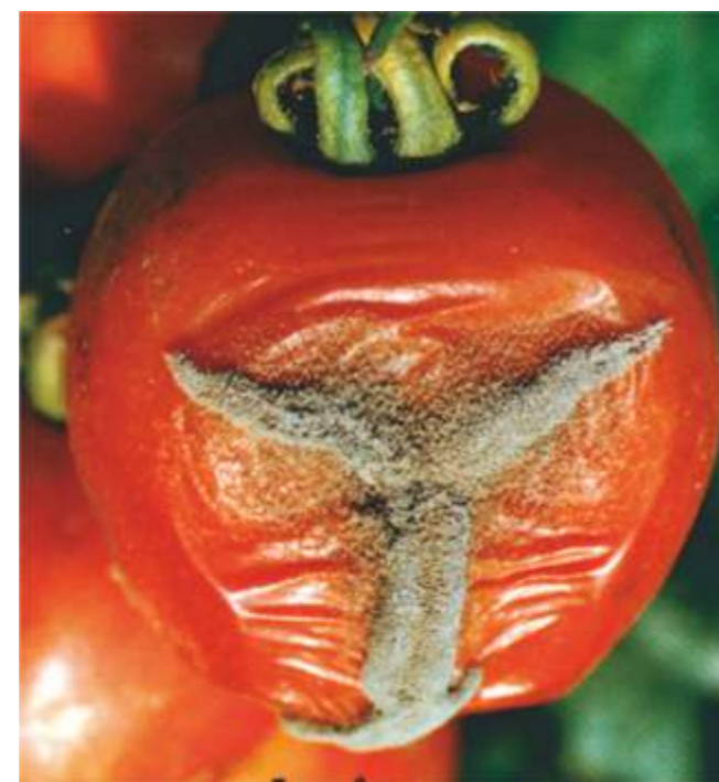
Podridão cinzenta ( Botrytis cinerea ) em tomateiro

Serenade® Max actua durante 7 dias à superfície das plantas para o controlo preventivo da podridão cinzenta e sem contribuir para o incremento de resíduos nos alimentos.