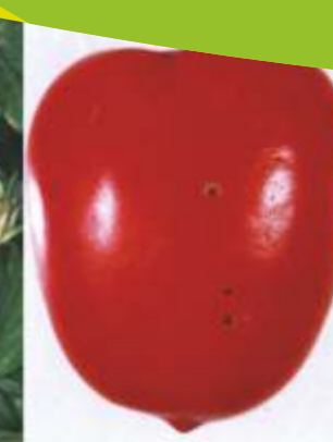
Bacteriose ( Pseudomonas syringae ) em tomateiro