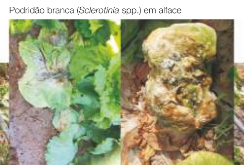
Podridão branca ( Sclerotinia spp.) em alface