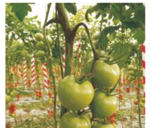
Bacteriose ( Pseudomonas syringae ) em tomateiro