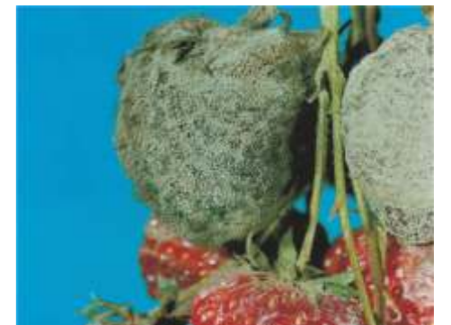
Podridão cinzenta ( Botrytis cinerea ) em morangueiro