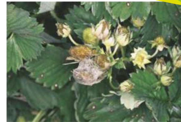
Podridão cinzenta ( Botrytis cinerea ) em morangueiro